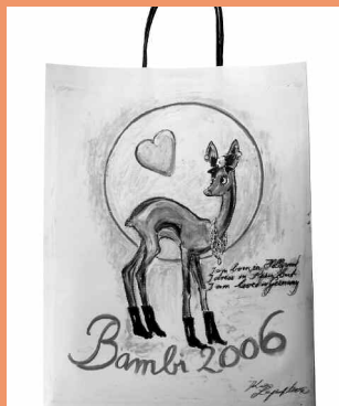
Breuninger Tragetasche, gestaltet von Karl Lagerfeld, Verkaufserlös fließt an die Stiftung „Tribute to Bambi“

Am 30. November wird der Fernseh- und Medienpreis Bambi erstmals in Stuttgart im Mercedes-Benz Museum verliehen. Was die wenigsten wissen: die Trophäen selbst werden in der Region Stuttgart hergestellt. Der Preis wurde 1948 geschaffen, 1958 gab es ein neues Metallmodell, das ausschließlich die Kunstgießerei Ernst Strassacker in Süssen fertigt. Das Modell wurde 2000 modernisiert und in der jetzigen Form zur Fertigung freigegeben. www.strassacker.de